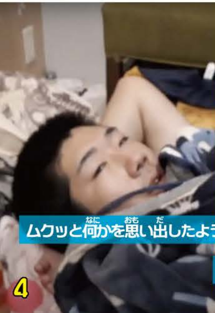
なに ムクツと おち 何かを だ 思い出したように お 起き上がるあだちさん