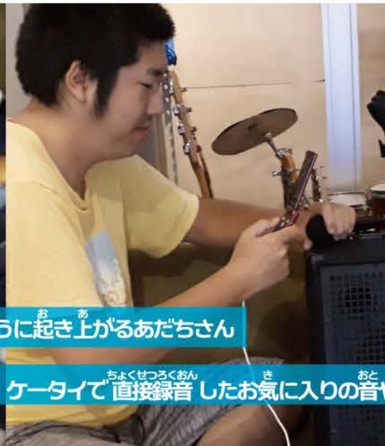
ケータイで ちよくせつろくおん 直接録音したお気に入りの音や音楽を おと 再生する。