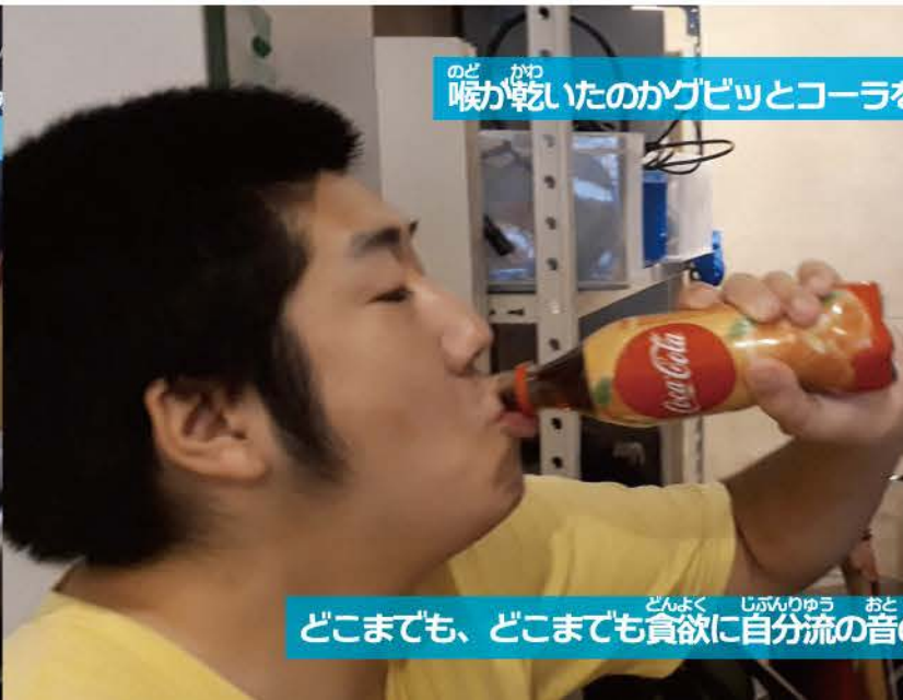
のど 喉が乾いたのか かわ グビツと の コーラを飲む。