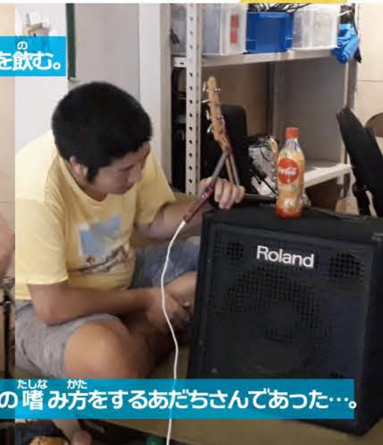
どこまでも、どこまでも どんよく 貪欲に じぶんりゅう 自分流の音の おと 嗜み方を たしな するあだちさんであった…。