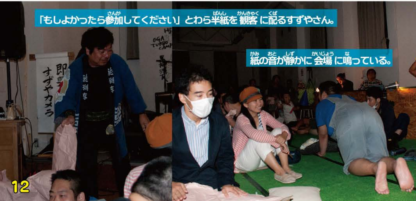
かみ おと しず かいじょう な 紙の音が静かに会場に鳴っている。